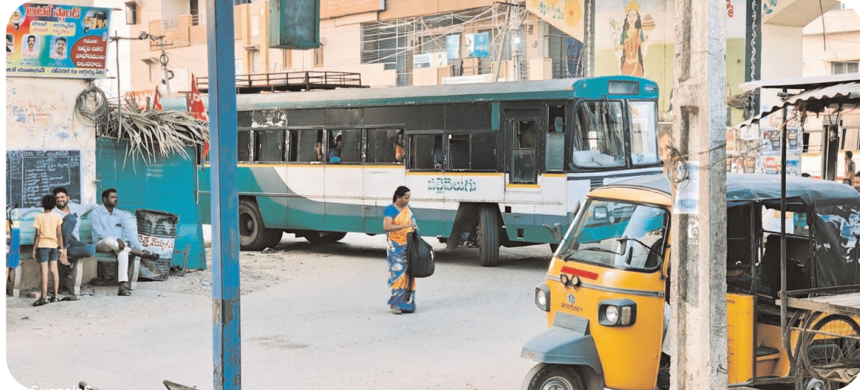
సౌకర్యవంతమైన రవాణా అందించడమే మా లక్ష్యం. మొత్తంగా, గ్రామపంచాయతీ తీసుకున్న ఈ చర్య బోనకల్లో అందుకోసం అందుబాటులో ఉన్న ప్రతి వనరును ఉపయోగించుకుంటూ సమస్యలకు పరిష్కారం చూపుతాం” అని తెలిపారు.

మరియు బ్రిడ్జి చివరగా ఉన్న మరొక కానాను వాహనాలు నిలిపేందుకు ఈ ప్రాంతాలను వాహనాల రాకపోకలకు అనుకూలంగా మార్చి, ప్రత్యామ్నాయ మార్గాలుగా అభివృద్ధి చేయాలని పంచాయతీ యోచిస్తోంది. ఇప్పటికే కొన్ని కాణాల కింద కొంతమంది స్థానికులు సొంత ప్రయోజనాల కోసం అక్కడ ఉన్న చెట్లను క్రమక్రమంగా తొలగించి గేదెలను కట్టివేయడం మరియు వ్యాపారాలు చేసుకోవడం కోసం ఉపయోగించుకుంటున్నారు. అందరికీ ఉపయోగపడే స్థానిక ప్రాంతాలు కొంతమంది మాత్రమే అనుభవిస్తుండడంతో స్థానికులకు తీవ్ర ఇబ్బందులు పడుతున్న విషయాన్ని స్థానిక పంచాయతీ పాలకవర్గం గమనించింది. ఈ చర్యతో ప్రధాన రహదారిపై ఉండే ఒత్తిడి తగ్గి, వాహనదారులకు సులభంగా ప్రయాణం చేసే వీలుంటుందని అధికారులు భావిస్తున్నారు. స్థానిక వ్యాపారులు, ప్రజలు ఈ నిర్ణయాన్ని స్వాగతిస్తూ, ట్రాఫిక్ సమస్యకు దీర్ఘకాలిక పరిష్కారం లభిస్తుందని ఆశాభావం వ్యక్తం చేస్తున్నారు. గ్రామ పంచాయతీ పాలకవర్గం మాట్లాడుతూ, “ప్రజలకు